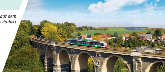
Citylink auf dem Bahrebachmühlviadukt