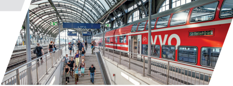
S-Bahn im Dresdner Hauptbahnhof

Weitere Informationen erhalten Sie bei den jeweiligen Bahngesellschaften sowie den InfoHotlines der Verkehrsverbände.