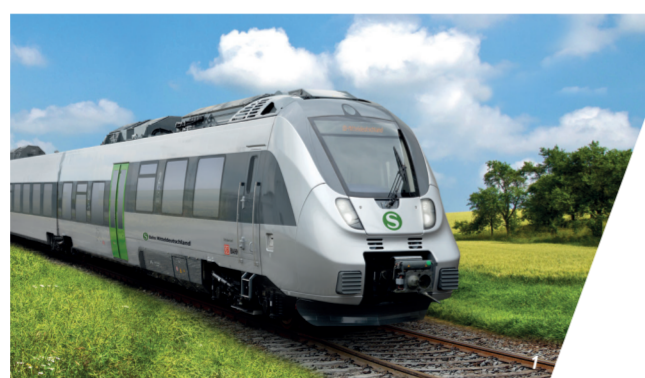
1-3 S-Bahn im Mitteldeutschen S-Bahn-Netz (MDSB)

© Herausgegeben vom Verkehrsverbund Oberelbe, Dresden 2021; Layout: Satz: VVO/Ü. Zschiesche. Für die Vollständigkeit der Angaben übernehmen wir keine Gewähr.