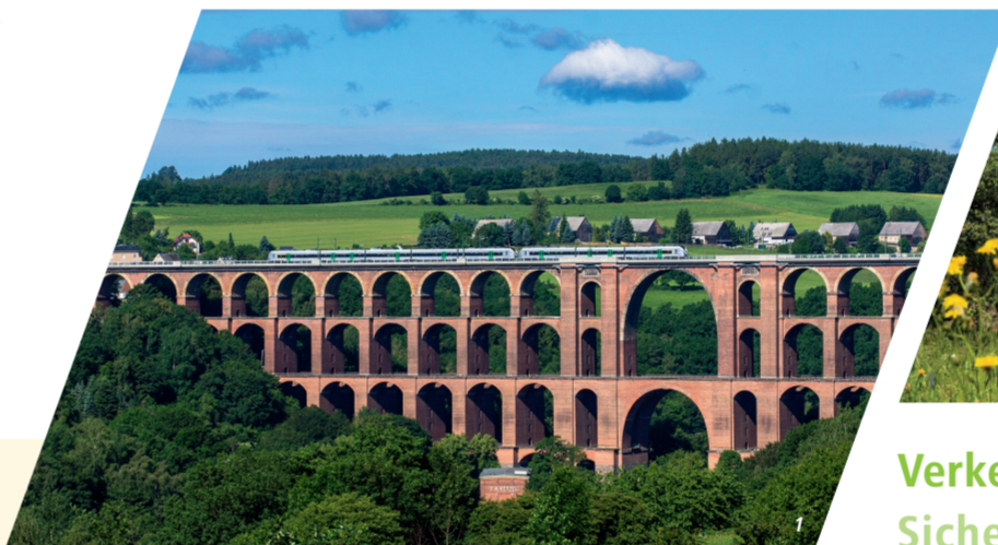
1 Göltzschtalbrücke 2-3 Regiohuttle der vogtlandbahn