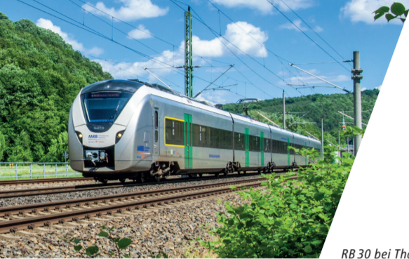
RB 30 bei Tharandt

Wir möchten Ihnen die Nutzung des öffentlichen Verkehrs so einfach wie möglich gestalten und verbessern die Anschlüsse zwischen Bus und Bahn, sorgen für ein einheitliches Tarifsystem, verständliche Informationen und kundenfreundlichen Service.