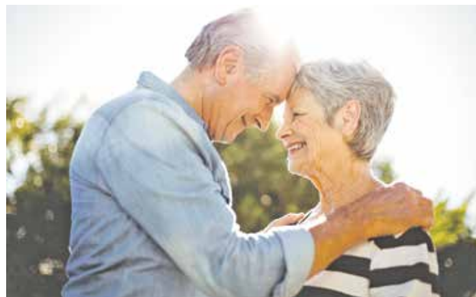
Die Gesellschaft wird immer individueller, das schlägt sich auch in den neuen Formen der Bestattungskultur nieder, ein Beispiel sind Erinnerungsdiamanten.

die restliche Asche kann beige- gesetzt werden. In Deutschland ist die Produktion der Diamanten verboten, der Besitz jedoch erlaubt. Brandenburg stellt hierbei eine Ausnahme dar. Dort kann man auf Erinnerungsdiamanten aus Haaren zurückgreifen, Infos: www.algordanza.com . Interessierte wenden sich an einen Bestatter ihrer Wahl. Quelle: djf