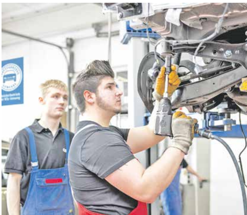
Der Kfz-Mechatroniker liegt bei jungen Männern auf Platz 1 der beliebtesten Ausbildungsberufe.