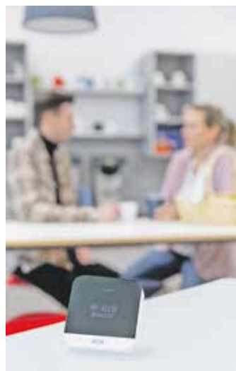
Das Display gibt laufend Auskunft über die CO 2 -Konzentration.