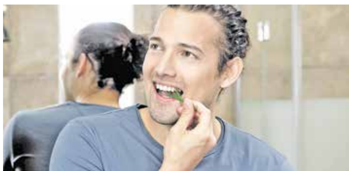
Sogenannte Mini Flosser sind vorgespannte Zahnseidenhalter für eine effiziente und komfortable Anwendung der Zahnseide.

Basis einer guten Zahnhygiene bleibt das zweimal tägliche