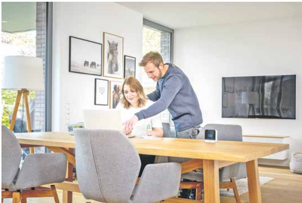
Vom Wohnzimmer über das Homeoffice bis zu Firmengebäuden und Klassenräumen lässt sich der CO 2 -Melder vielfältig verwenden.

Die Konzentration lässt nach, bleierne Müdigkeit macht sich breit, bei manchem kommen auch noch Kopfschmerzen hinzu: Häufig sind dies deutliche Warnzeichen für eine ungesunde Raumluft. Wenn der Kohlenstoffdioxidanteil zu sehr ansteigt, kann dies empfindlich das Wohlbefinden beeinträchtigen. In der Außenluft liegt der CO 2 -Anteil abhängig von der aktuellen Witterung und weiteren Faktoren bei etwa 400 ppm (parts per million). Beträgt der Wert in Innenräumen 1.000 ppm und mehr, gilt die Luftqualität als bedenklich. In der Folge können Reizungen der Augen und der Schleimhäute auftreten, hinzu kommen möglicherweise Aufmerksamkeitsstörungen und Kopfweh.