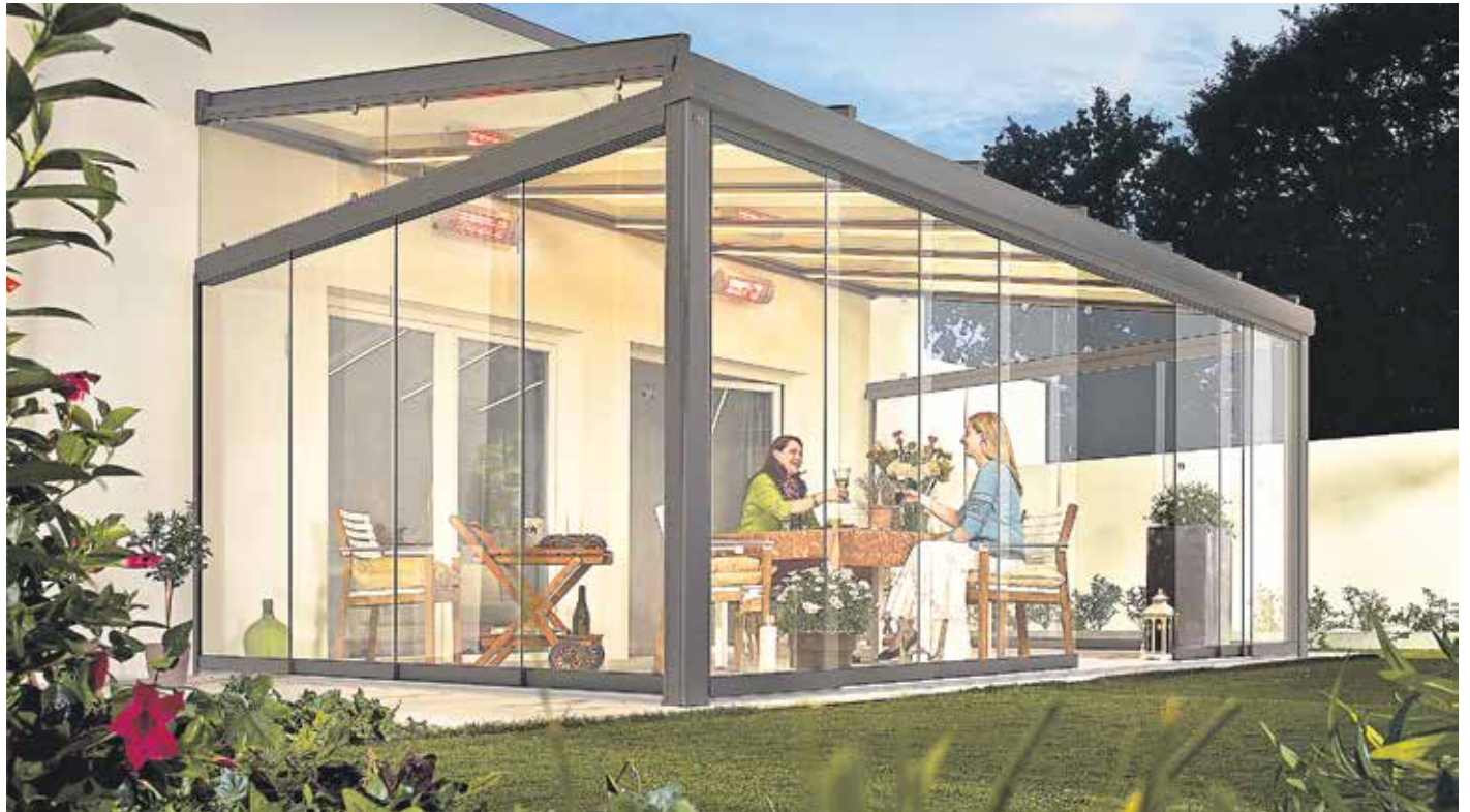
Eine rundum verglaste Terrasse lässt sich als Stimmungsaufheller nutzen, wenn die Tage kürzer werden und der Winterblues droht.

Leicht zu realisieren ist eine Terrassenverglasung mit Glasdachsystemen, die sich mit zusätzlichen Elementen rundum schließen lassen. Unter www.lewens-markisen.de gibt es dazu mehr Infos. Sie bieten nicht die